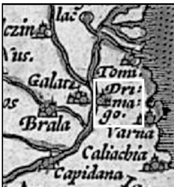
Drimago на карта на Ортелиус от 1570 г.

Съотв. първите, китайците наричат «да юеши / юечжи» 大月氏, т.е. «големи юечжи», а вторите - «сяо юеши