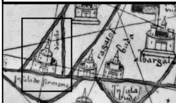
Dinaco в "Каталанския атлас" от 1375 г. автор: Абрахам Крескес