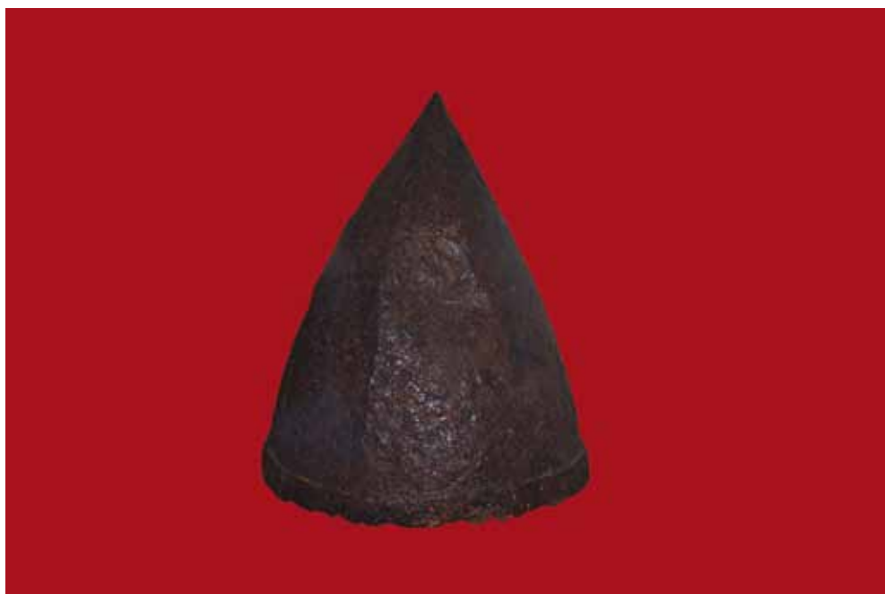
Рис. 7. Серьги в виде знака вопроса и шлем из могильника средневекового Перника, XII–XIII вв. (Региональный исторический музей, Перник).