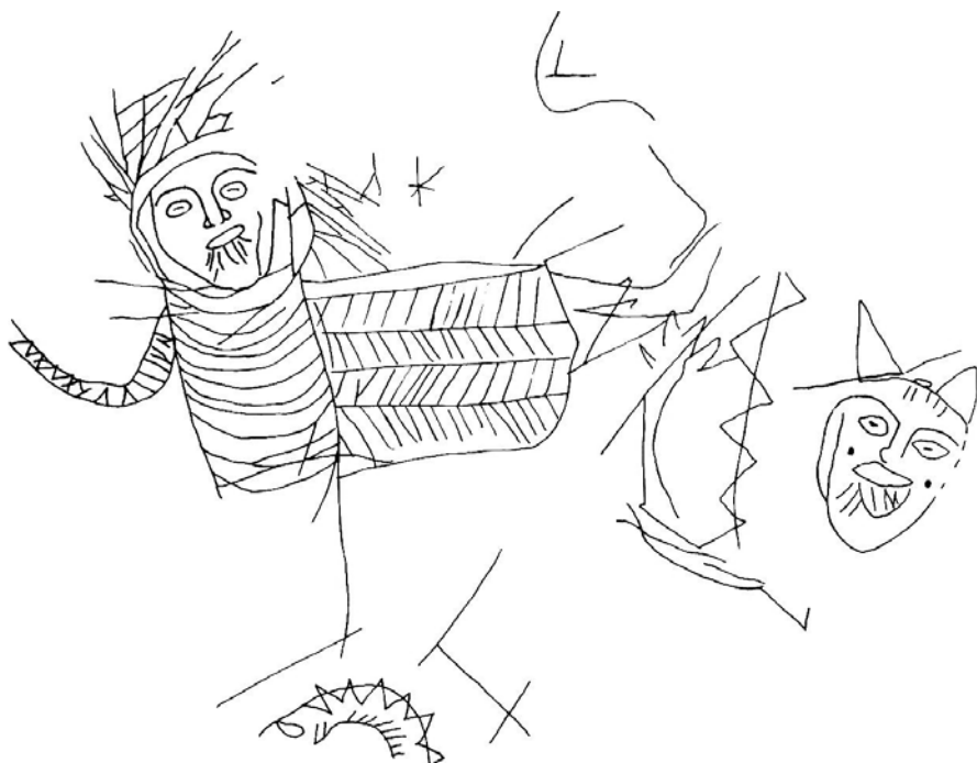
Рис. 6. Изображение шамана на сосуде из Велико Тырнова – вид и графическая реконструкция (см. Алексиев, 1989, с. 441, обр. 1; с. 447, обр. 2).