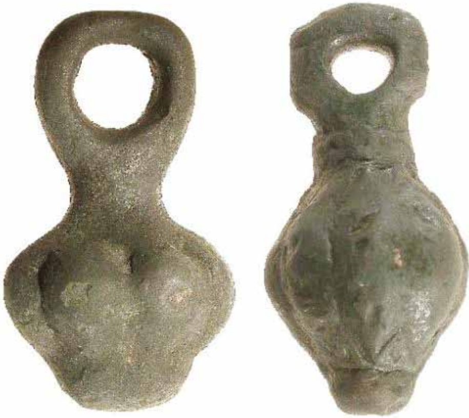
Рис. 5. Кистени «куманского типа» из Северо-Восточной Болгарии, XII в. (Региональный исторический музей, г. Варна).