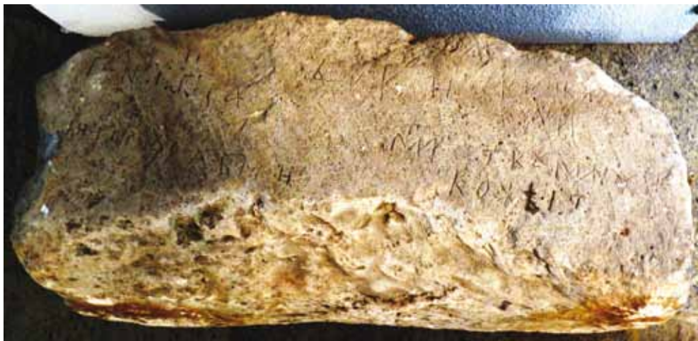
Рис. 3. Каменная надпись из Преслава, повествующая о куманях (Археологический музей, Велики Преслав).