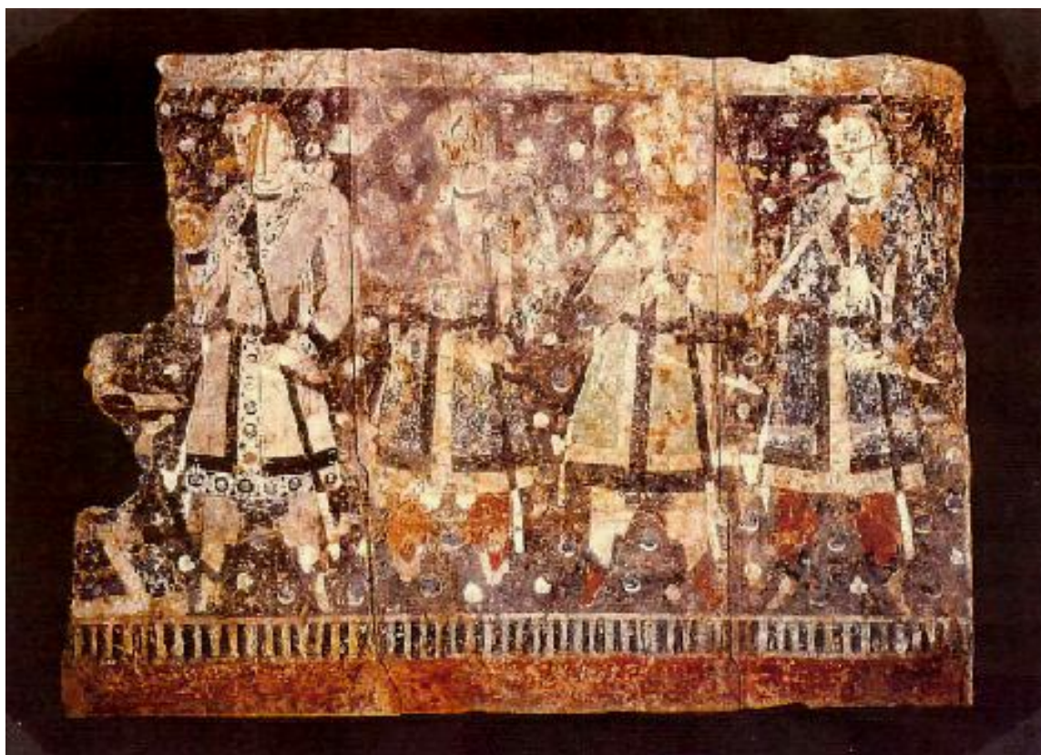
Четирама тохарски аристократи-дарители, Казъл (600-650 г.)