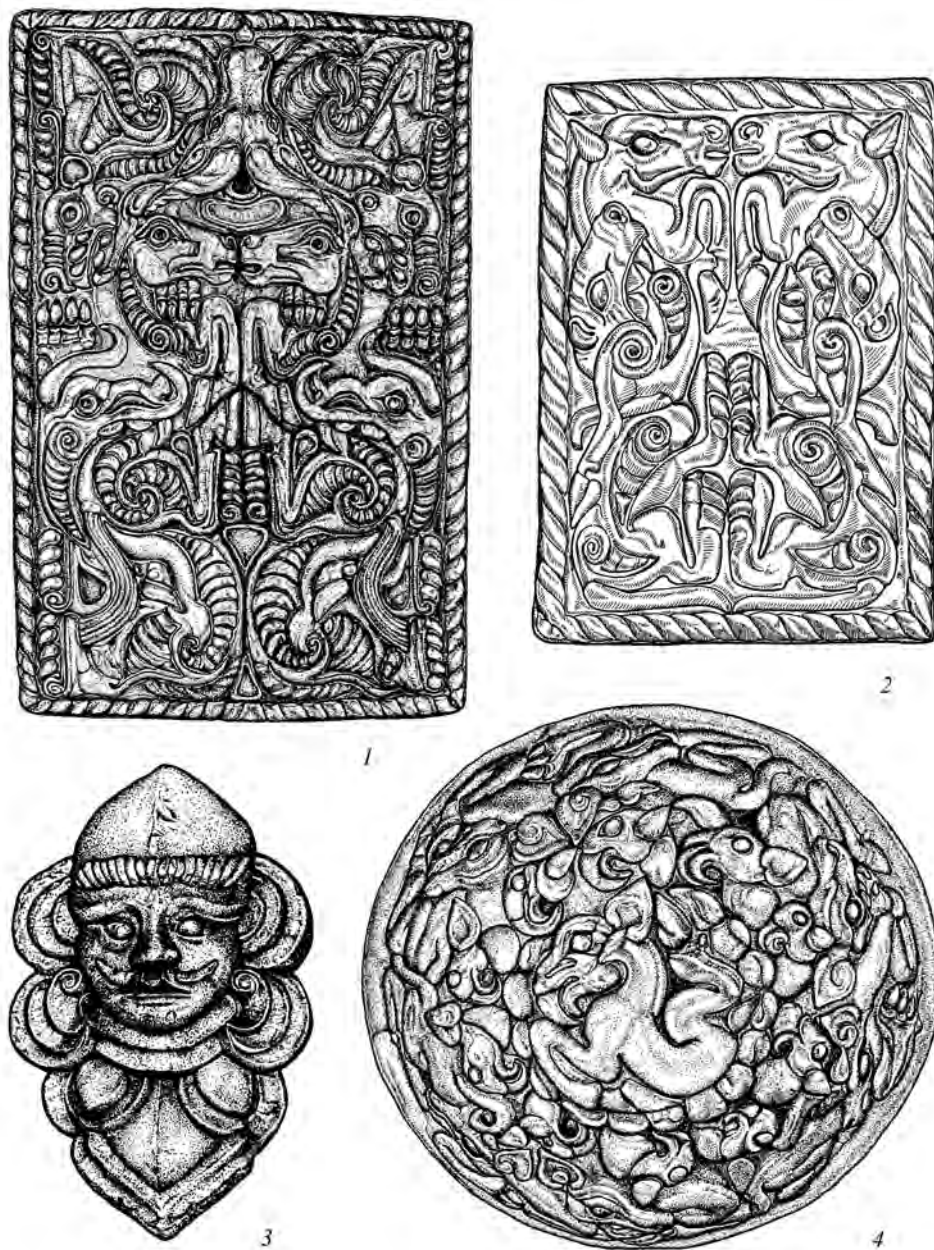
Рис. 1. Могила Синьчжуантоу М30. Золотые изделия

1, 2 – поясные пластины (длина 10,8 см; 5,6 см); 3 – бляха в форме розетки (высота 5,1 см); 4 – выпуклая бляха (диаметр 4,7 см) (прорисовки по фотографиям из: Хэбэй шэн , 1996; Ши Юнши , 1997)