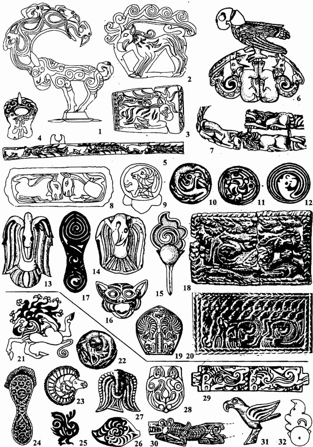
Рис. 2. 1,9 — Налиньгаоту; 2-5,8,13,14 — Сигоупань М2; 6,7,10-12,15,16 — Алучайдэн; 18 — Саньин; 19 — могила Лю Шэна; 20 — могила Лю Чжи; 21,24,25 — 2 Пазырыкский курган; 22 — Дужерглиг-Ховузу-1, к. 2; 23 — 1 Пазырыкский курган; 26 — 2 Башадарский курган; 27 — Ак-Алаха-1, к. 1; 28 — Эрмитажное собрание; 29 — Саглы-Бажи-11, к. 8; 30 — Уландрык-1, к. 12; 31 — Юстыд-111, к. 8; 32 — 1 Туэктинский курган.

1-3,5,7,8,10-12,14,15,18-20 — золото; 4,22 — бронза; 6 — золото, лазурит; 13 — свинец; 9,16,17 — серебро; 21 — татуировка; 23-26 — кожа; 27,28,30-32 — дерево; 29 — рог.