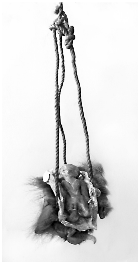
Рис. 2. Йёрёх . МАЭ. Колл. № 1040-15.

Глиняные фигурки специально изучались Г.И. Дзенискевич и А.А. Трофимовым. Г.И. Дзенискевич обращает внимание на связь глиняных фигурок «с первоначальными растительными йерехами и с ранними антропоморфными изображениями в виде тряпичных кукол. Например, на животе одного идола (№ 1040–15, рис. 2) вылеплены две ветки, похожие на рябиновые, другой же идол (№ 1040–14, рис. 3) держит в