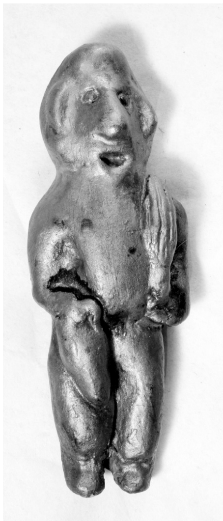
Рис. 3. Йёрёх. МАЭ. Колл. № 1040-14.

Выходя замуж, девушка брала с собой кузовок с Йёрёхом и вешала его в новом жилище. «А ее отец устраивал вместо взятого кузова новый» 33 .