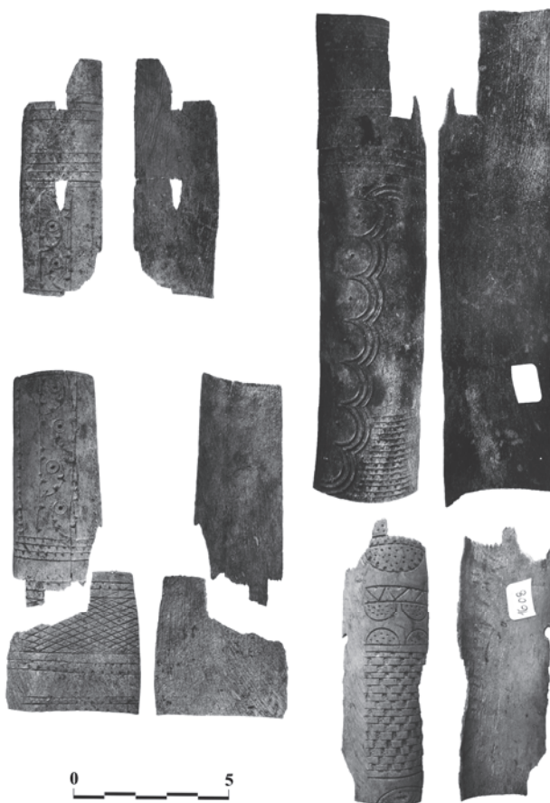
Рис. 2. Костяные украшения для колчанов, найденные на холме Трапезица, Велико-Тырново [42, с. 54].