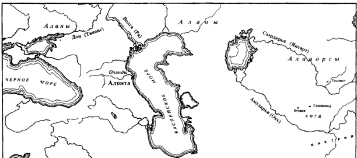
рис. 1. Расселение алан по Птолемию